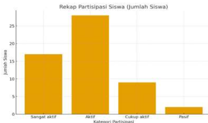
Gambar 2. Diagram Partisipasi Siswa

Data pada Tabel menunjukkan bahwa 80% siswa berada pada kategori aktif dan sangat aktif. Hal ini mengindikasikan bahwa pembelajaran yang mengintegrasikan interaksi aktif dan empatik mampu menciptakan suasana belajar yang kondusif. Meskipun demikian, masih terdapat 2 siswa (4%) yang pasif dan memerlukan pendekatan personal serta bimbingan lanjutan.